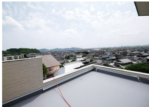
展望バルコニーからの景色は最高！立地を活かした設計です